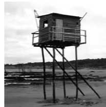
Cabane de pêcheur sur la côte bretonne

La figure de l'hermite, dans un esprit de retraite, de contemplation; La figure du chasseur-cueilleur, de l'enfant sauvage, dans un esprit de jeu, de troc, et de survie; ou bien encore la figure du chamane, du curador, du garde forestier qui lui à la charge de prendre soin de cette même nature.