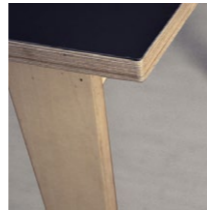
Vue de détail

Un partenariat avec les fabricants Nora (revêtements de sols) rend possible de décliner les tables selon une gamme colorée, laissant également la possibilité au client de faire évoluer la couleur de son mobilier au gré de son envie.