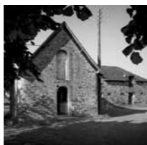
Ferme en son état existant