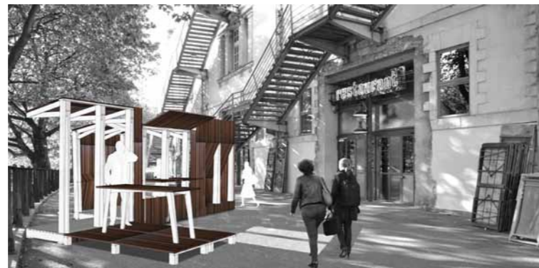
Insertion du modulomeuble dans un contexte urbain: ici sur le parvis du Lieu Unique

L'appel à projet a pour objet la conception, la fabrication et l'animation d'un atelier mobile de création. Le module doit pouvoir se loger sur une place de stationnement. "Le nomadisme socio-économique" et "La Ville économe" sont deux axes d'exploration et de recherche-action autour de la démarche artistique "d'upcycling" développés dans le cadre du concours 2014.