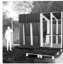
Mise en situation rurale

Programme : Atelier mobile de création. Situation: Nantes | Pays de la Loire Dimension : 4,3m x 2,5m Organisation: Le Carré Bouge, et Le Copa-Via Paysage Appel à projet : Révolution sensible Equipe: Porteur de projet: 100 détours Design: JKA - Jérémie Koempfen Architecture Fabrication, agencement: Quedubois Calendrier : Concours 05/2014 - projet lauréat Participation à Parking days sur l'île de Nantes: 09/2014 Participation au salon des métiers d'art à Nantes: 12/2014