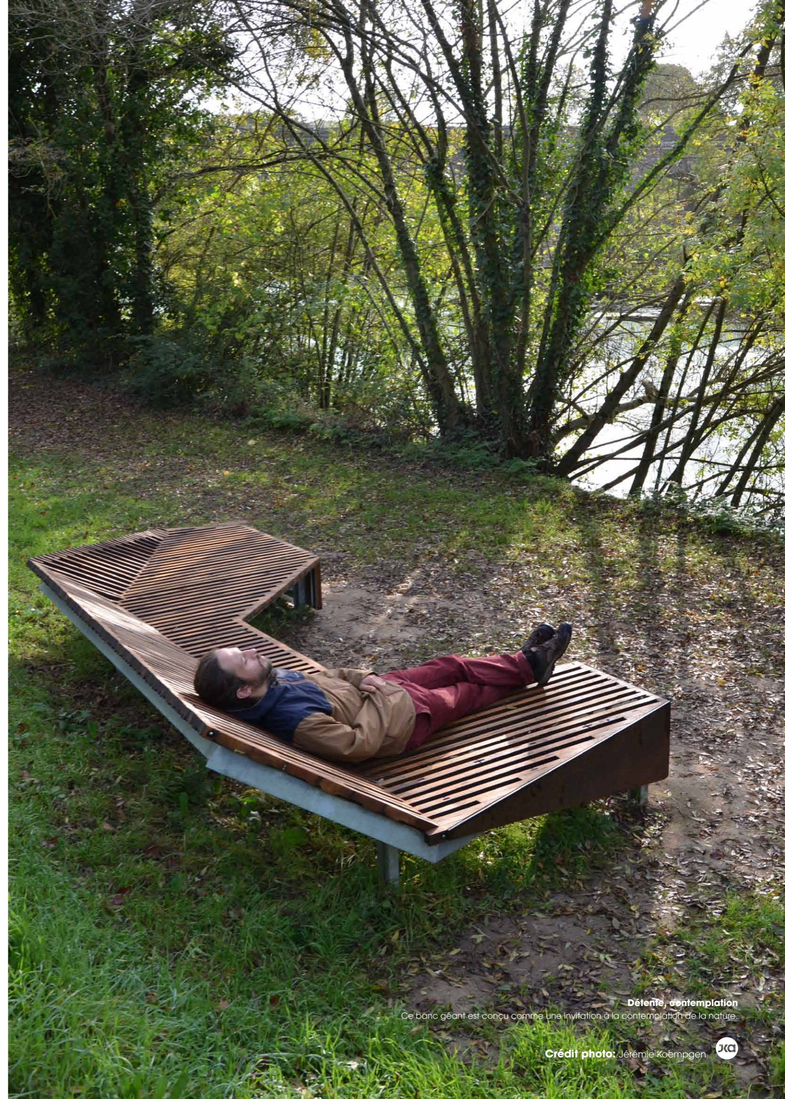
Détente, contemplation Ce banc géant est conçu comme une invitation à la contemplation de la nature.