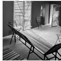
Mobiliers rangés dans la tomate

LA HAIE-FOUASSIÈRE - LOIRE ATLANTIQUE (44)