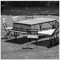
Ensemble roulant et modulable

Le lattes de 3cm x 1cm est fabriqué à base de bois issu de fenêtres déposées, d'essences variées et mélangées: exotiques rouges et chêne brun clair principalement.